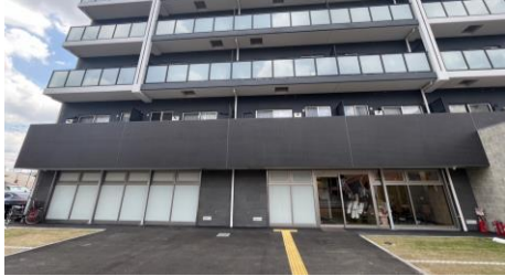
■ 本体外観(本社は1階フロアのみ)

2022年12月23日に東京証券取引所スタンダード市場に上場。同日に、福岡証券取引所本則市場に市場変更。近年は賃貸事業も展開中。