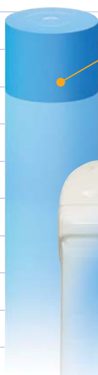
HS-20/21 ハイパワーモード